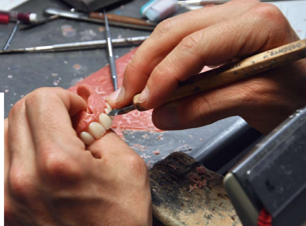
Mit viel Liebe zum Detail zu hochwertigstem Zahnersatz.